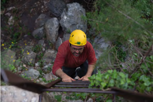
Fig. 112. Descenso por la escalera metálica instalada en la confluencia del barranco del Bosque de Don Gonzalo con el cañón (FR).

En la pared izquierda diferenciamos cuatro elementos pictóricos. El primero lo forman restos muy deteriorados de una figura esquemática lobulada en rojo rosáceo, de 13 cms. de altura y 8 de anchura, compuesta por un trazo recto de 5 cms. sobre el que aparecen restos de una circunferencia de 6 cms. de diámetro, sobresaliendo de su extremo superior una pequeña protuberancia. Lamentablemente, las fuertes alteraciones de la pared de la cueva impiden decir más.