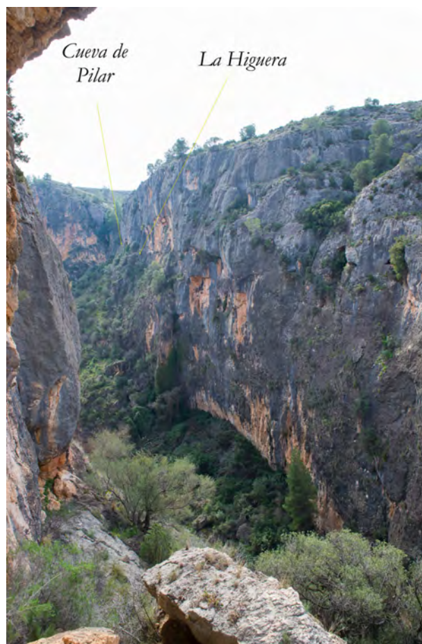
Fig. 111. Vista de la pared derecha del cañón, desde El Laberinto, con la ubicación de las cuevas de Pilar y La Higuera (FR).

A unos 30 m. de esa escalera, dejando atrás algunas cavidades sin interés arqueológico, llegamos a una cueva de 7 m. de anchura en su entrada, 3 de altura y suelo de tierra, que profundiza 14 m. en horizontal dentro de la roca, formando una pequeña galería ligeramente serpenteante. Los restos pictóricos los localizamos en la zona más exterior de la cavidad, en ambas paredes, apenas perceptibles y en muy mal estado de conservación.