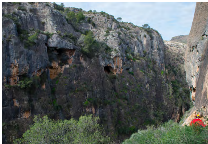
Fig. 99. Vista general del conjunto de Las Enredaderas, desde El Laberinto, en la pared de enfrente (FR).

Frente a El Laberinto pero a una cota algo mayor, en la margen derecha del río, una pequeña depresión (a la derecha de la foto) da paso a un conjunto de seis cavidades que conocemos como Las Enredaderas . Una de ellas, la más septentrional, está separada del resto (V) y carece de valor arqueológico. El resto forma parte de una visera que desde esa depresión de acceso se dirige al sur, pegada a la pared, hasta llegar a desaparecer en una pared vertical que solo se salva escalando.