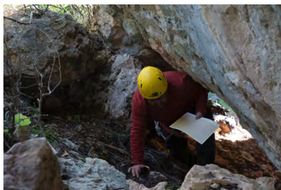
Fig. 100. Labores de inspección de Enredaderas II (izquierda) y acceso desde Enredaderas I (FR).