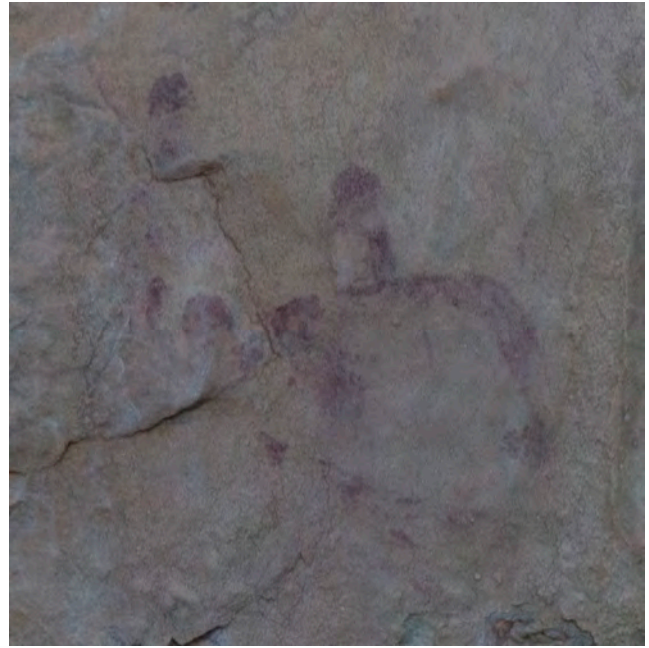
Fig. 108. Imagen real (arriba) (FR) y calco (abajo) del polilobulado globular, de Enredaderas VI.