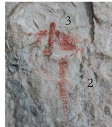
Fig. 105. De izquierda a derecha, respectivamente, panel principal de Enredaderas II y detalle de oculo ramiforme (arriba) y antropomorfo tipo golondrina con un cruciforme (abajo) (FR).

También llamamos la atención sobre un antropomorfo tipo golondrina (3), un cruciforme (2) y un antropomorfo en phi muy deteriorado por un desconche (6).