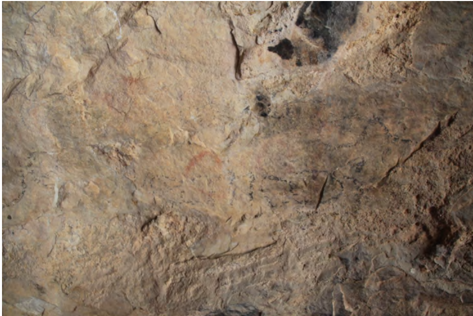
Fig. 37. Círculos en rojo correspondientes a arte rupestre prehistórico, y sobre ellos, restos de grafitis de época moderna, hechos con carboncillo, en Rumíes I (IML).

pasa con un pequeño trazo vertical y varias manchas aisladas de un color similar al polilobulado del primer panel.