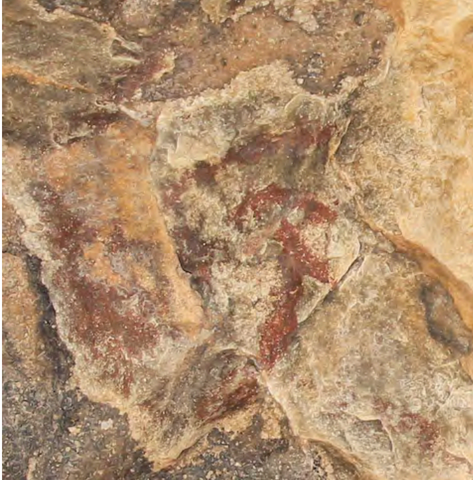
Fig. 39. Antropomorfo de Rumíes II, acompañado de trazos en su parte inferior derecha, superior izquierda y sobre él, y una mancha informe a la izquierda (IML).

En Rumíes II , presidiendo el centro de esta cavidad a la que cuesta trepar, hay un pequeño paño de roca liso en el que se pintó un pequeño antropomorfo cruciforme de 11 cms. de altura, con el extremo superior en forma de montera, como ocurre con la famosa figura en phi de La Serreta; al lado, una segunda figura formada por una gran mancha informe.