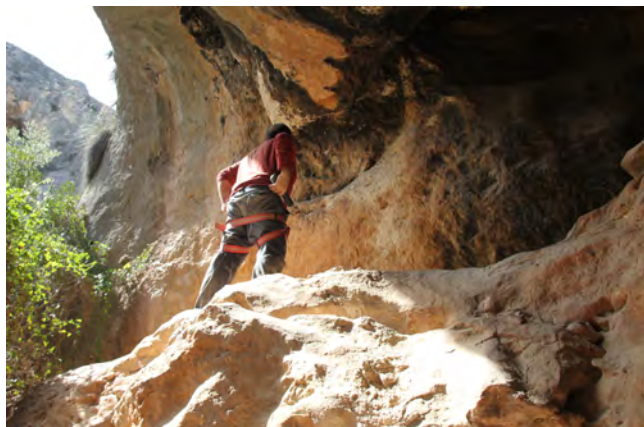
Fig. 34. Inspeccionando la pared de Rumíes I, en el sector en el que se encuentra el polilobulado (IML).

especificar. Durante los trabajos de 2017 hemos topografiado toda la cavidad y descrito 15 elementos pictóricos en el abrigo principal y dos en el otro espacio.