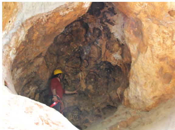
Fig. 35. Cavidad de Rumíes II, señalando la ubicación del antropomorfo (IML).