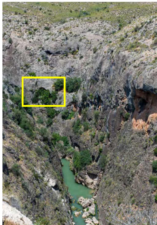
Fig. 34. Posición de Los Rumíes en la pared izquierda del cañón (FR).

La primera noticia de estas pinturas la debemos al Grupo de Espeleología Almadenes, que las descubren a inicios de la década de los 90 del s. XX. El estudio de las mismas se realiza en el marco de las prospecciones llevadas a cabo tras ese descubrimiento (Salmerón et al, 1997; 1999a), describiéndose de manera detallada dos figuras, con sus calcos, y citándose la existencia de otras, sin