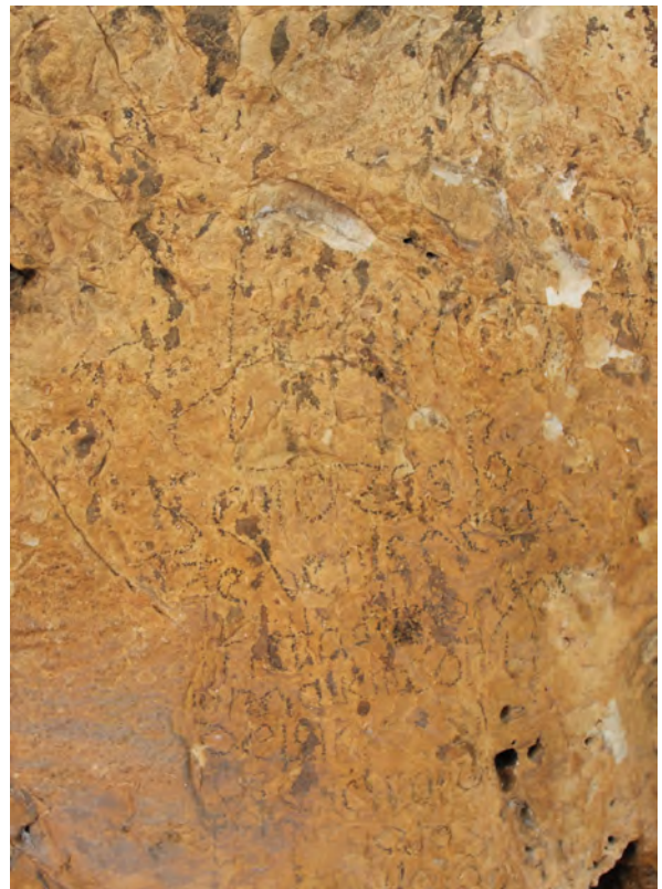
Fig. 38. Texto en varias líneas de Rumíes I (IML).

Por encima de este texto se ha identificado un puntiforme en color rojo anaranjado, como los círculos el panel anterior, y que consideramos también prehistórico.