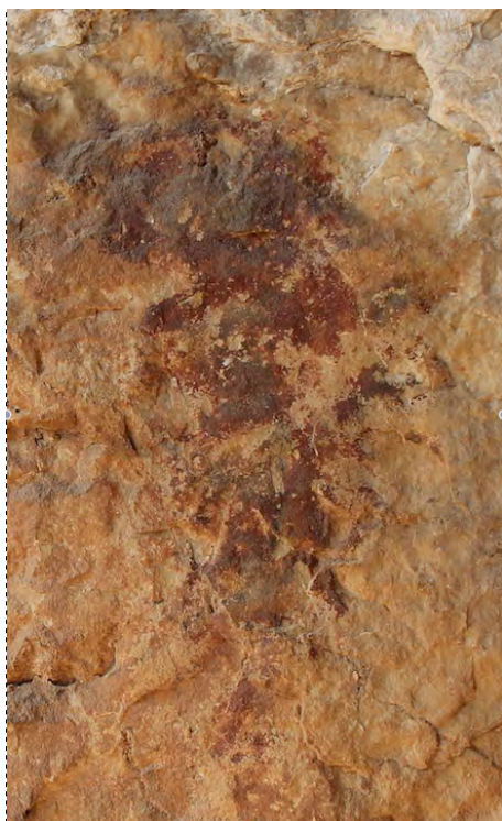
Fig. 36. Polilobulado de Rumíes I (IML).

Las 15 figuras de Rumíes I se distribuyen en cuatro sectores diferentes de la cueva, que se han definido como otros tantos paneles, numerados de izquierda a derecha. En el primero de ellos, sobre la visera de la pared izquierda del abrigo, localizamos un pequeño trazo aislado pintado probablemente con una pluma, a unos metros un estupendo polilobulado bien identificable aunque algo deteriorado, y entre ambas figuras, una mancha informe, teniendo todas un tono rojo violáceo.