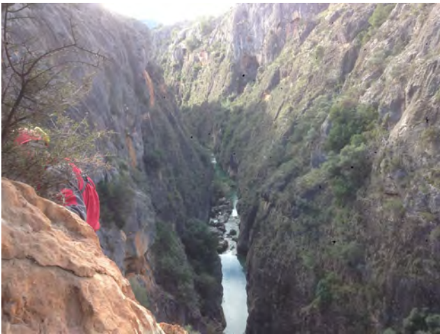
Fig. 41. Vista del Segura hacia el sur, desde El Paso I, que se sitúa ya dentro del propio cañón (JLM).

En El Paso I localizamos primero (de izquierda a derecha) un grupo de manchas informes, dos puntos aislados y más a la derecha y aislado, un pequeño trazo vertical, todo en el mismo color rojo oscuro.