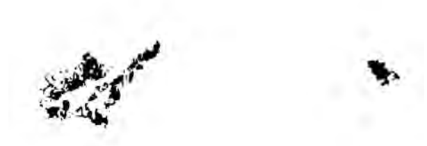
Fig. 42. Calco del grupo de manchas en rojo vinoso, de El Paso I.

En El Paso II , de nuevo varias manchas informes y trazos aislados de similares características a las de la otra cueva.