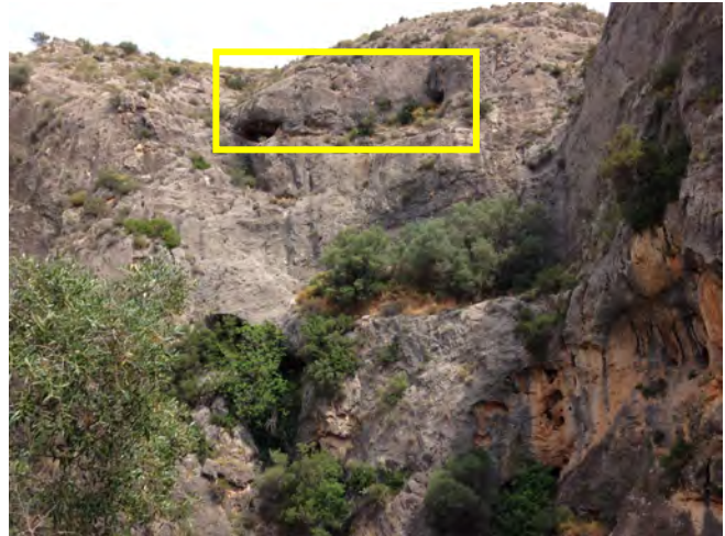
Fig. 40. Posición de El Paso I (izquierda) y II (derecha); obsérvese, bajo la visera inferior y tras una densa vegetación, el conjunto de Rumíes (JLM).

Se accede al conjunto descendiendo 12 m. con equipo de escalada hasta el más occidental de ellos, El Paso I , una cavidad de 5 m. de longitud y 5 de profundidad, con una altura media de 1,6 m. y varias oquedades en sus paredes, una de las cuales profundiza en forma de grieta horizontal, aprovechada como guarida por algunos pequeños depredadores.