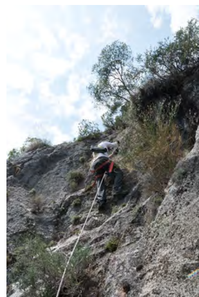
Fig. 45. Descendiendo al conjunto de Cuevas de Fran (FR).