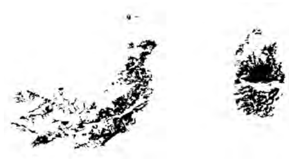
Fig. 47. Manchas informes en el techo de Cueva de Fran I (izquierda) (FR) y calco de las mismas (derecha).

En el panel I, cinco manchas informes y varios restos de trazos de distinto tamaño próximos entre sí, que por el estado de conservación del panel podría ser lo poco que queda de un conjunto de figuras hoy desaparecidas. Luego tenemos dos líneas paralelas pintadas sobre el arco del techo que diferencia los dos espacios de la cueva, uno de ellos bien conservado mientras que el otro está muy afectado por un desconchado, coincidiendo además todo con una concreción caliza que difumina la figura, que pudo quizás ser un antropomorfo (panel II). Más a la derecha aún (panel III) encontramos restos mal conservados de un antropomorfo en phi de 12 x 7 cms.