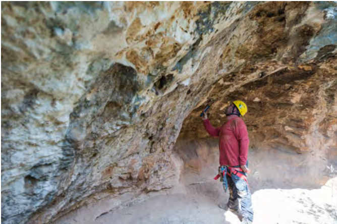
Fig. 46. Revisando las paredes de Cueva de Fran III (FR).

El conjunto se descubrió en 2017 con motivo de los trabajos de campo posteriores al incendio, dentro del programa que seguimos de ir descendiendo a todas y cada una de las cavidades del cañón. Esta labor de inspección, que continúa, se ha programado una vez comprobado que incluso en lugares completamente inaccesibles podemos hallar pinturas o cerámica prehistórica. Nada de ello habría sido posible sin la cobertura del grupo de espeleología GECA de Cieza.