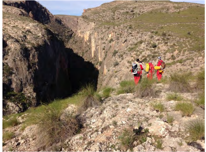
Fig. 19. Equipo de espeleología dirigiéndose a Los Rumíes y El Paso, en la margen izquierda del cañón. Al fondo a la derecha, el Alto de La Mulata.