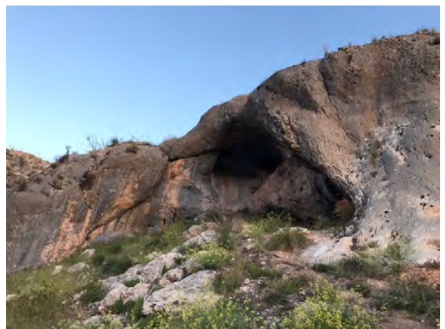
Fig. 22. Cueva del Arco (JFR).

Se ha establecido así una secuencia del Paleolítico superior y, bajo ella, una inesperada ocupación neandertal. Los trabajos aún continúan, presentándose ahora primicias sobre las dos primeras campañas de 2015-16 y 2017.