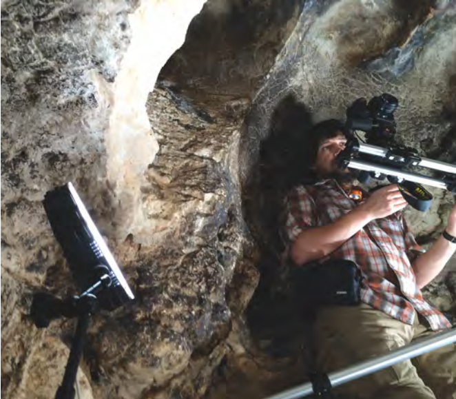
Fig. 21. Captura fotográfica para levantamiento fotogramétrico en la Cueva de las Cabras (JFR).

El primer nivel ha consistido en la evaluación arqueológica del paraje y sus yacimientos tras el incendio, siendo el vehículo para hacer una propuesta interpretativa de conjunto a través del tiempo y plantear estrategias de intervención, difusión y puesta en valor del mismo. Para ello, se ha hecho un seguimiento de los trabajos forestales tras el incendio; se han revisado las cuevas con arte postpaleolítico, actualizando la documentación gráfica y rehaciendo los calcos y topografías; y se han efectuado hallazgos de nuevas pinturas, tanto en cuevas ya conocidas como en otras inéditas.