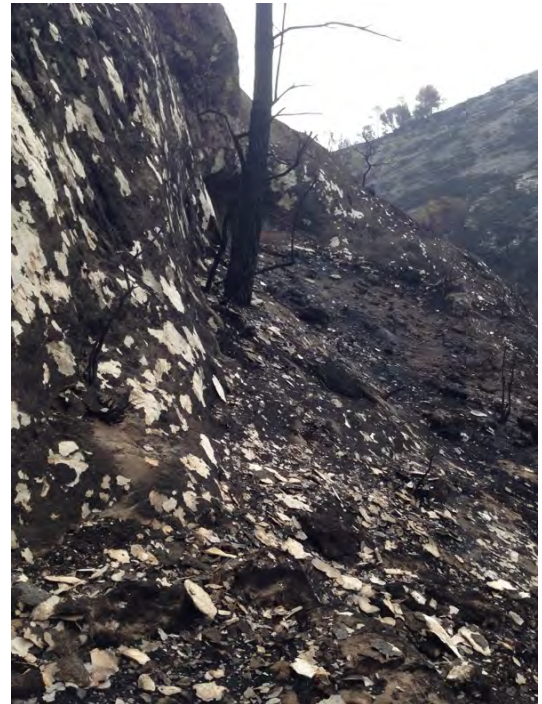
Fig. 18. Paredes calizas en el Barranco de la Tabaquera, donde se alcanzaron 700°C durante el incendio, horas después de su extinción (JLM).

Entre las primeras destacamos la tala del arbolado quemado y la limpieza del ramaje carbonizado que cubría toda zona, así como la instalación de medios físicos para mitigar la acción erosiva de las aguas de escorrentía tras las lluvias, dada la escasa presencia de suelo sobre esta masa caliza. No se optó por llevar a cabo una repoblación forestal, dada la fragilidad del ecosistema, prefiriéndose llevar un control exhaustivo de la regeneración natural de la vegetación y fauna. En cuanto a las orientadas al patrimonio arqueológico, son las que traen causa de esta exposición.