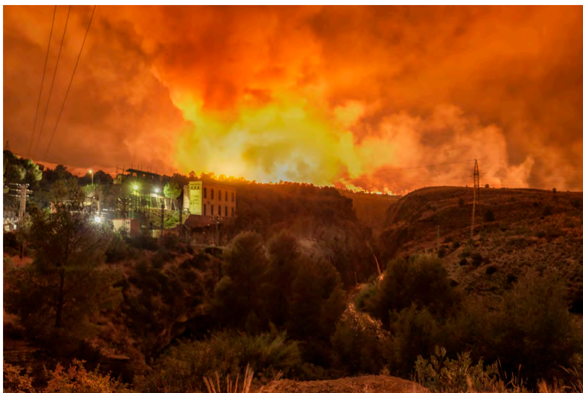
Fig. 17. El incendio en la noche del 8 al 9 de agosto de 2015, visto aguas abajo de la central eléctrica de Almadenes

En el caso de la sierra de La Palera, un rayo encendió un pavoroso incendio que, aparentemente controlado, a las 24 horas de haberse iniciado enfiló el paraje de Los Almadenes, quemando finalmente 356 hectáreas (y 50 más en el área de El Almorchón) de alto valor ecológico, paisajístico y patrimonial, hasta que a finales del día 10 se declaró extinguido.