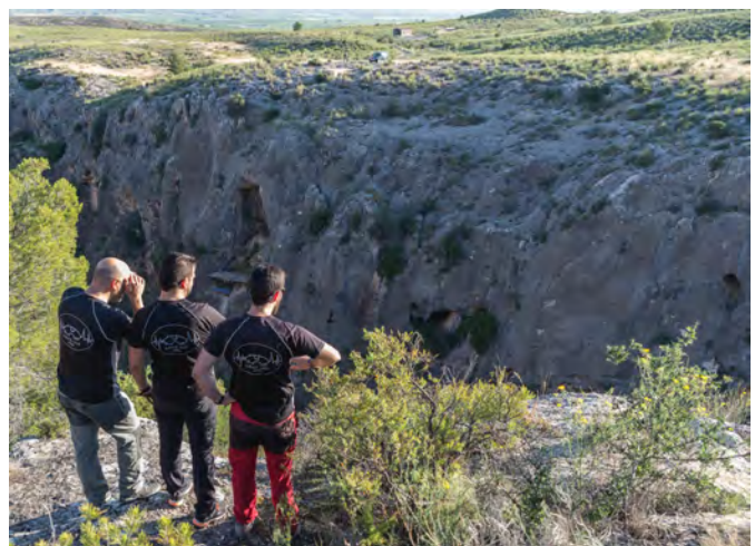
Fig. 125. Miembros del G.E.C.A. planificando el descenso a El Miedo, desde la pared contraria del cañón (FR).

Queremos dejar constancia de esa labor encomiable y hacer un público agradecimiento a ese estar siempre pendientes de nosotros, pero también del paraje singular al que nos hemos dedicado. Lo sienten como algo propio y es escuela para formar a las nuevas generaciones en el amor a su tierra y a la Naturaleza. Han sido las piernas que nos han permitido llegar a la mayor parte de las cuevas y nuestros ojos allí donde no alcanzábamos. Sin ellos y ellas, nada habría salido posible. Gracias.