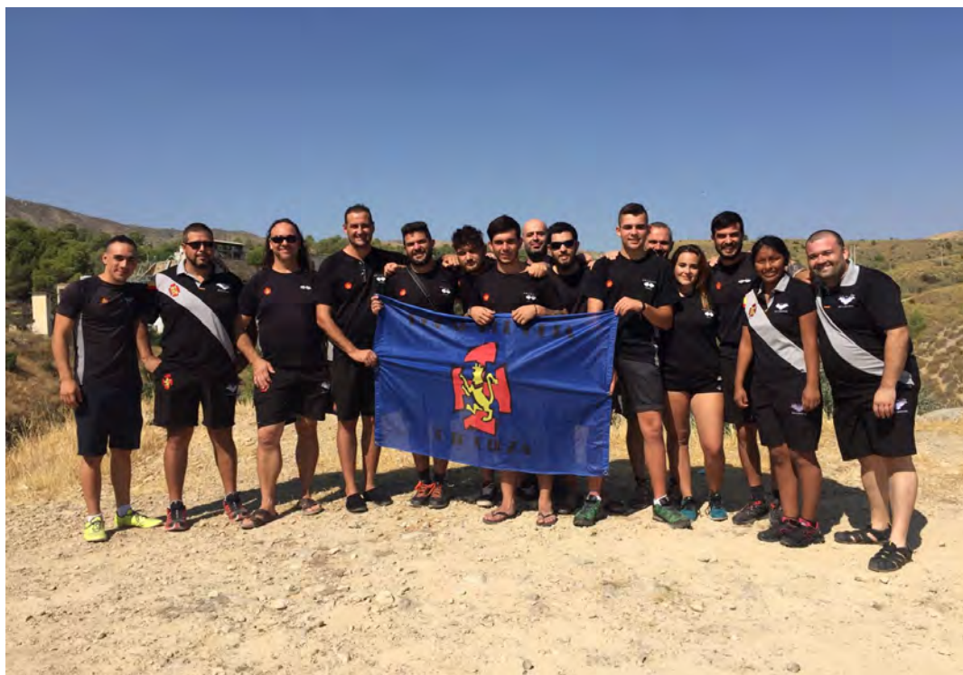
Fig. 123. Miembros del G.E.C.A. de la O.J.E. de Cieza que nos han ayudado estos tres años.

Todos esos trabajos han tenido un elevado componente arqueológico, tanto de excavación como de prospección y supervisión, en los que han participado un nutrido grupo de estudiantes de Historia de la Universidad de Murcia. Pero toda la inspección de las cavidades con arte postpaleolítico localizadas en el propio cañón de Almadenes han precisado del continuo auxilio de especialistas en Espeleología, y en este sentido ha sido insustituible la disponibilidad y buen hacer de los miembros del Grupo de Espeleología Ciezano Atalaya (G.E.C.A.) de la O.J.E. de Cieza, asociación que, además, ha proporcionado alojamiento, de manera igualmente altruista, al equipo de excavaciones de Cueva del Arco en la campaña de 2017.